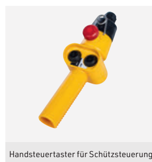
Handsteuertaster für Schützsteuerung