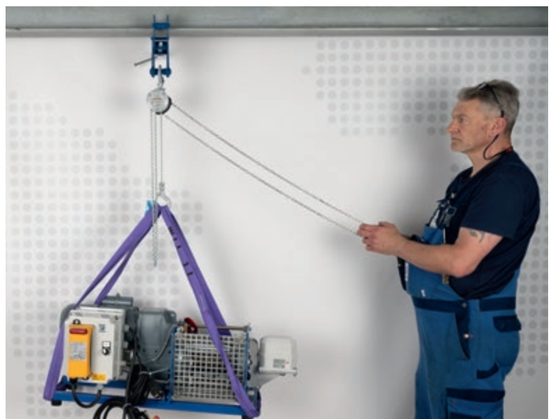
Anwendungsbeispiel: Bediener steht rechts neben der Last