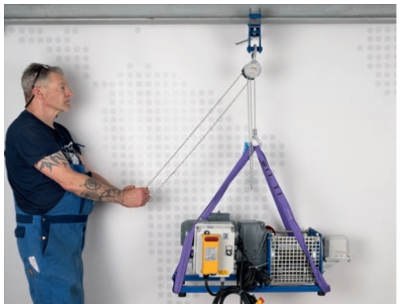
Anwendungsbeispiel: Bediener steht links neben der Last