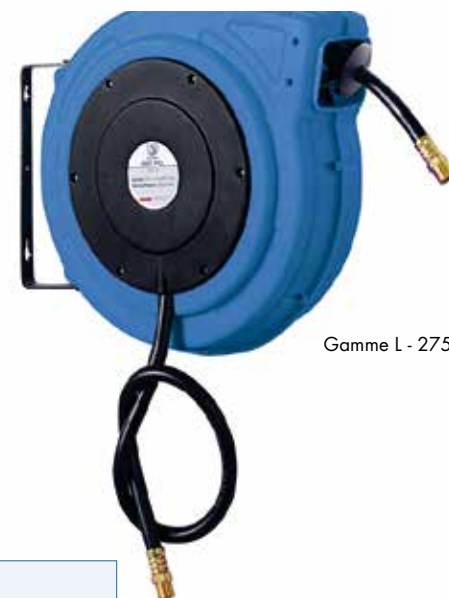
Gamme L - 275