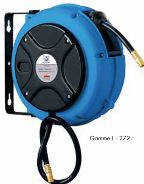
Gamme L - 272